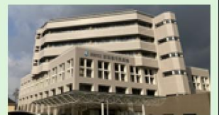
新南陽市民病院 800m 徒歩10分