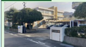
富田東小学校 520m 徒歩7分