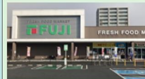
フジ新南陽店 400m 徒歩5分