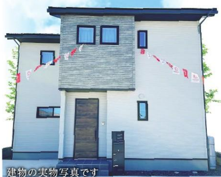
建物の実物写真です