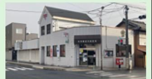
新南陽政所郵便局 200m 徒歩3分